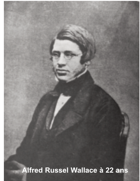
Alfred Russel Wallace à 22 ans

C'est dans les années 1860, qu'il commença à s'intéresser aux recherches psychiques en Angleterre. Il était un matérialiste si confirmé qu'il ne pouvait absolument pas concevoir la possibilité de l'après vie. Pourtant, les faits l'ont battu, pour citer ses propres mots dans la préface de son livre : Les miracles et le moderne spiritualisme paru en 1874 dont voici un extrait : «J'étais un matérialiste si parfait et si éprouvé, que je ne pouvais en ce temps trouver place dans ma pensée pour la conception d'une existence