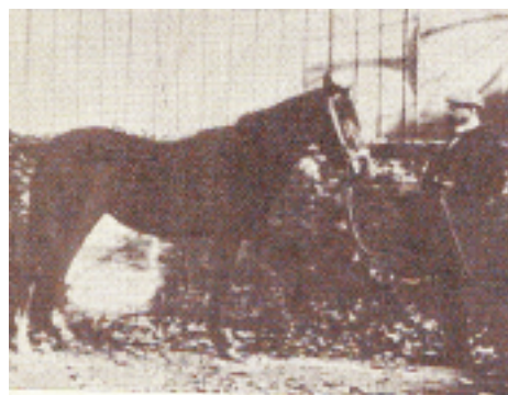
Comment on apprend à un cheval à compter par des coups de sabots.

- Parce qu'il dit qu'au commencement de la leçon, il ne veut rien savoir !